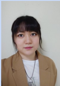
玉川学園高等部国際バカロレア (IB)クラス卒業 コミュニケーション学科