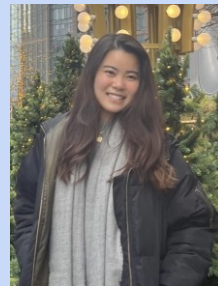
埼玉県立草加南高等学校卒業 国際関係学科