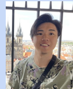
マリアットビル高等学校卒業 コミュニケーション学科